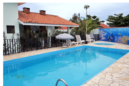
Colônia Beleza e Arte Caraguatatuba

Reservas e informações com o Seecethar: (18) 3621-1594. Reservas na colônia de Caraguatatuba: (11) 3331-5866