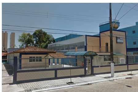
Colônia Petroleiros Praia Grande