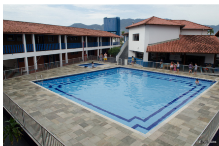
Colônia Sindifícios Caraguatatuba