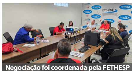
Negociação foi coordenada pela FETHESP